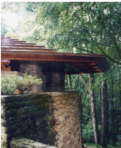
写真:上 Fallingwater、 下 Kentuck Knob