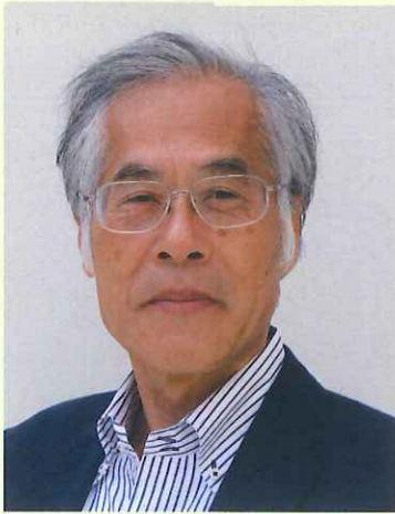
藤森照信 (ふじもり てるのぶ)

建築家、建築史家、東京大学名誉教授、工学院大学特任教授 1946年生まれ、長野県出身。東北大学工学部卒業、東京大学大学院建築学専攻博士課程修了。東京大学生産技術研究所教授、工学院大学教授歴任。 1991年に神長官守矢史料館（長野県）で建築家としてデビュー。昨2015年「草屋根」(La Collina 近江八幡/たねや店舗)竣工。他茶室、美術館、住宅など建築作品多数。 著書に『日本木造遺産 千年の建築を旅する』（世界文化社、2014）、『藤森照信×山口晃 日本建築集中講義』（淡交社、2013）等多数。