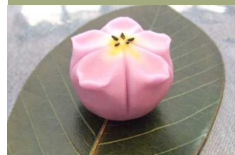
季節の和菓子「桔梗」