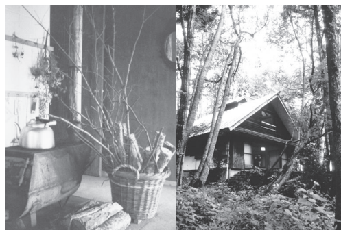
黒姫山荘 居間のストーブ 所蔵:ちひろ美術館

1972年『あかまんまとうげ』(童心社)より 絵:いわさきちひろ 所蔵:ちひろ美術館