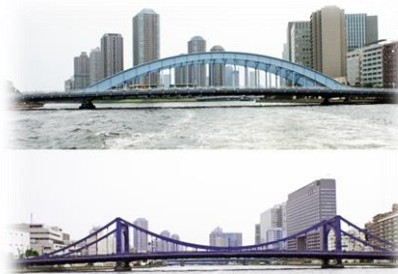
△復興小学校 △永代橋と清洲橋