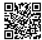
申込み QR コード

問合せ先： UIFA JAPON 事務局 (小池) : kyk-25@hb.tp1.jp